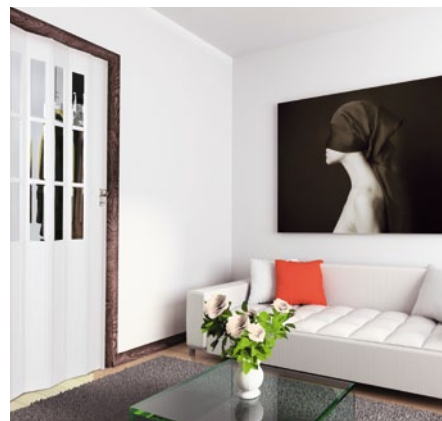
NewEdition – ein Schmuckstück für die moderne Raumgestaltung.