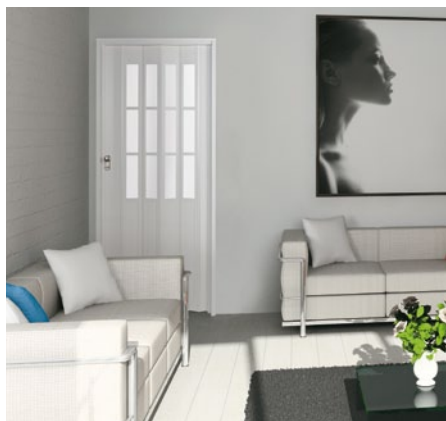
Die Lösung für Türen in verwinkelten Räumen.