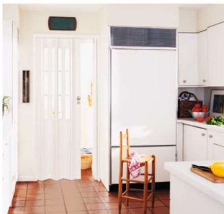
So werden schmale Durchgänge zu Lichtschleusen.